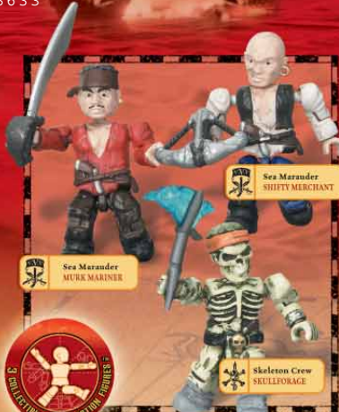
Sea Marauder SHUFFY MERCHANT