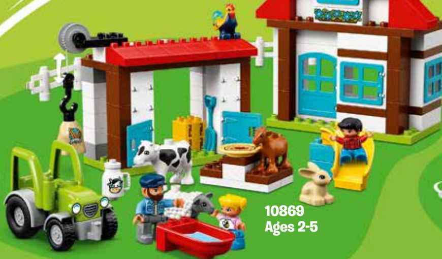
10869 Ages 2-5