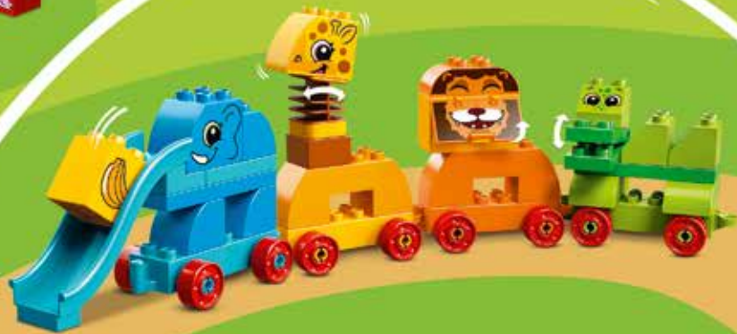
10863 Ages 1½-3