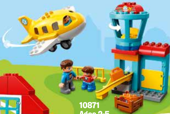
10871 Ages 2-5