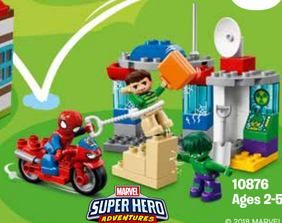
10876 Ages 2-5