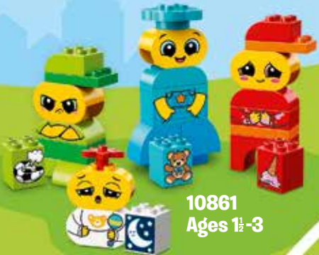
10861 Ages 1½-3