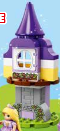
10878 Ages 2-5